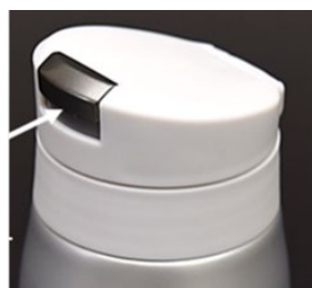
キャップボタン部分 (採用事例)