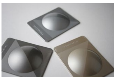
サンプルプレート

塗装レス材料として提案している「ナノコン/NANOCON®（原着）」は、塗装工程の削減や塗装不良による材料ロスの削減に貢献します。塗装工程を削減することで、エネルギー使用量を抑制することができ、製品のライフサイクル全体で見たCO 2 排出量を抑制することができます。また、塗料に含まれる揮発性有機化合物（VOC）の発生防止にも繋がります。美しい外観と色調が特徴で、自動車や建材の内装部品などに適した材料です。豊富なカラーバリエーションからの選択や、お客様のニーズに合わせたカスタム着色も可能です。また、耐傷つき性向上グレードや抗菌グレードなど、さらなる性能を付与したグレードも展開しています。