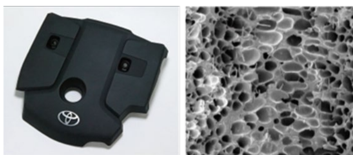
図 3. 「Foamilon®」の採用事例と発泡状況

「Foamilon®」は、射出成形時に樹脂を発泡することで製品の軽量化を行うと共に、樹脂の使用量削減に貢献するリデュース材料です。比剛性が高いことから、同じ剛性の製品では30%以上の軽量化を実現できます。また、良流動で低圧成形も行えることから、成形機のダウンサイジングが可能となり、省エネルギー・省コストにも貢献することができます。