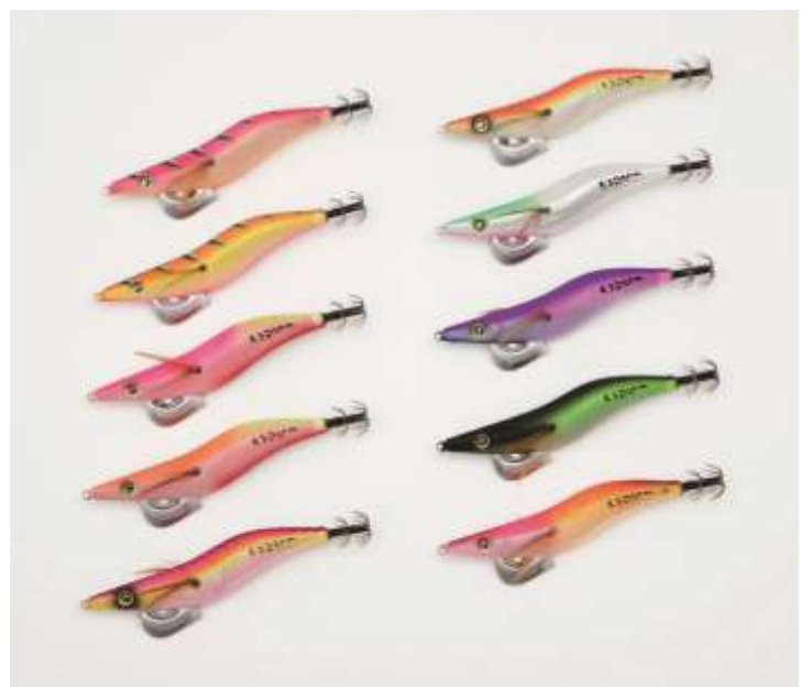
『エギエスツーβ(ベータ)』 カラーラインナップ