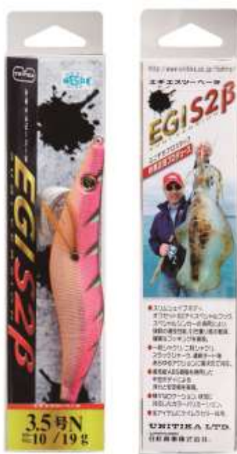
『エギエスツーβ(ベータ)』 (写真 左・表面/右・裏面)