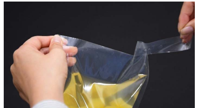
ウェブサイト「THE POWER OF MATERIALS」 『直線カット性包装用フィルム（必ず、まっすぐ編）』の1シーン