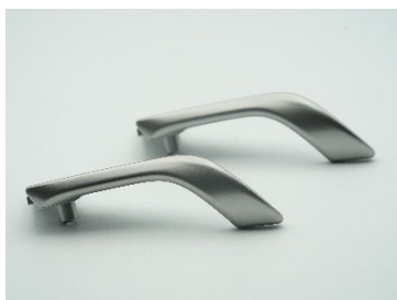
高輝度メタリック着色樹脂 「NANOCON」