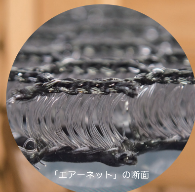
「エアーネット」の断面