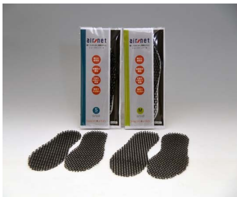
高機能インソール「air・net」のパッケージと商品